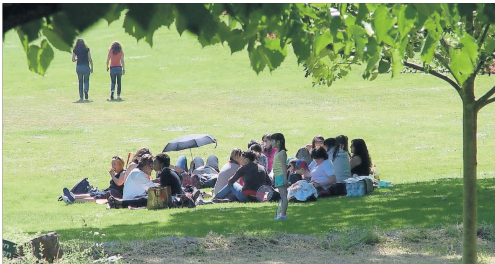
Der Luisenpark: In diesem beliebten und bei gutem Wetter belebten Naherholungsgebiet fand 1975 die Bundesgartenschau statt. Die Konversion bietet die einmalige Chance, in einigen Jahren diese Veranstaltung wieder nach Mannheim zu holen.