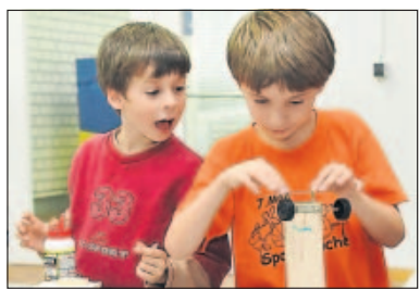
Technik macht Spaß!

Ein breites Programm, bestehend aus Vorträgen, Workshops und Präsentationen verschiedener Bildungseinrichtungen, Firmen und Verlage, bringt die Teilnehmer auf den neuesten Stand der Technikdidaktik und regt zum gemeinsamen Ideen-Austausch an. Unter den über 35 Ausstellern befinden sich namhafte Institutionen wie die Hochschule Mannheim, BBQ Südwestmetall, Lego oder der Klett Mint Verlag. Die Experten vermitteln unter anderem, wie die Hirnforschung beim Lernen und Lehren helfen kann und geben Hilfestellung bei komplizierten Sachverhalten wie der Kälte- und Wärmetechnik oder Fahrassistenzsystemen. Auch Umweltbildung durch Technikunterricht ist ein Thema.