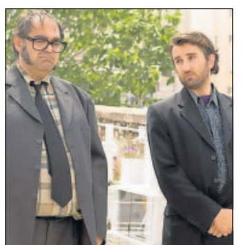
Die Matinee am Sonntagmorgen.

Der neue Film von Jean-Pierre Jeunet, dem Regisseur von Erfolgen wie „Die fabelhafte Welt der Amelie“, erfuhr bereits letzte Woche großen Zuspruch. Skurrile Figuren und der typische eigenwillige Inszenierungsstil Jeunets zeichnen auch diese Komödie um einen Filmfreak und seine absonderlichen Freunde aus.