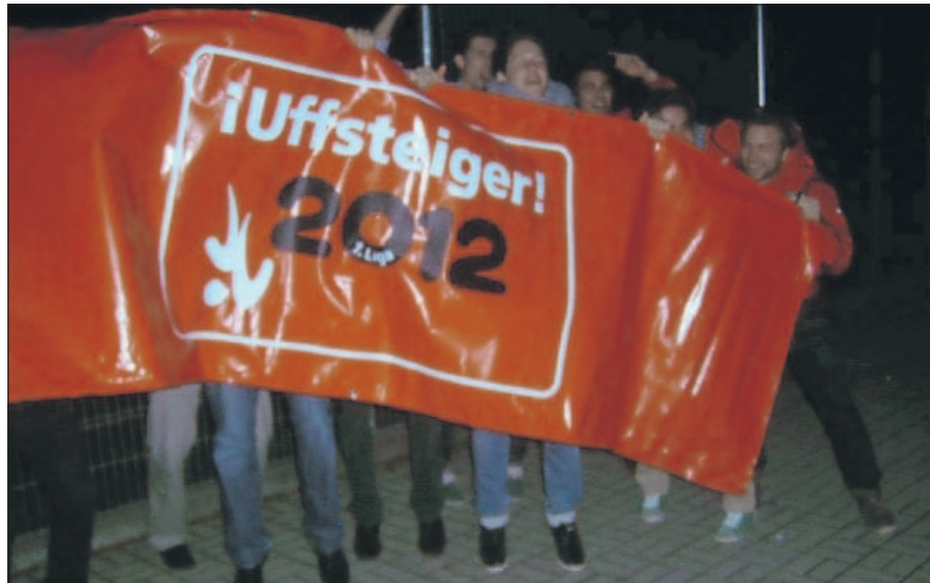
Ein Transparent spricht Bände. Der TSMVH ist wieder erstklassig.

Mit der Wiederholung des Doppeltrophäums der Damen des TSV Mannheim Hockey und der Herren vom Mannheimer HC aus dem Jahr 2010 hat es bei der Endrunde um die Deutsche Hallenhockeymeisterschaft bekanntermaßen nicht geklappt. Im Berliner Horst-Korber-Sportzentrum war im Halbfinale für beide Mannheimer Teams der spätere Meister Rot-Weiss Köln die Endstation. Die Halbfinalspiele gegen die Domstädter verliefen dabei nicht ganz unähnlich, denn sowohl bei der 4:9 (3:4)-Niederlage der TSV-Damen als auch bei der 2:4 (2:3)-Pleite der MHC-Herren, waren im Spiel zunächst die Quadratestädter tonangebend. Auch der Mannheimer Fananhang machte sich in der Hauptstadt lautstark bemerkbar und ließ sich auch nicht durch die Halbfinalniederlagen entmutigen, schließlich ist ein Platz unter den besten Vier alles andere als eine Schande. Riesenjubel gab es nun eine Woche später, denn durch den 5:1 (2:1)-Sieg bei der HG Nürnberg schafften die Herren vom TSV Mannheim Hockey am Sonntag vorzeitig den Aufstieg in die Erste Hallenhockeybundesliga, wo man in der nächsten Saison auf den Lokalrivalen Mannheimer HC trifft. Nach langer Erstligaabstie-