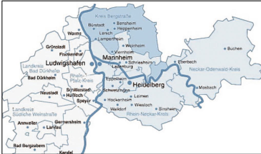
Die Ausdehnung der Metropolregion Rhein-Neckar in drei Bundesländer: Baden-Württemberg, Rheinland-Pfalz und Hessen.

Der Verband Der Verband Region Rhein-Neckar