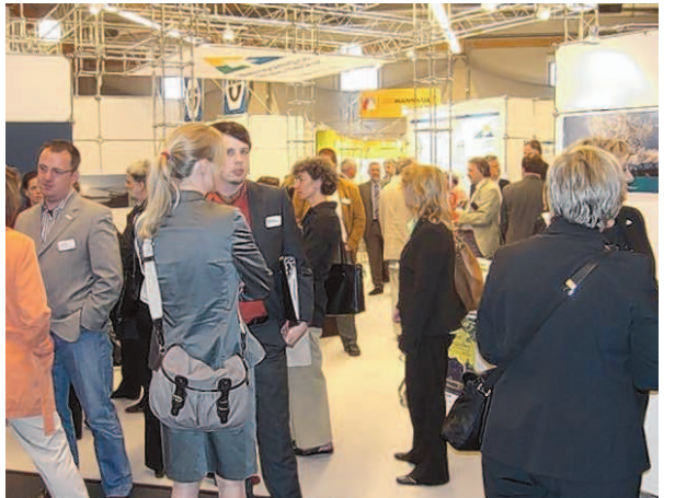
Ab dem 25. April präsentiert sich die Metropolregion Rhein-Neckar wieder in der Halle der Region auf dem Maimarkt.