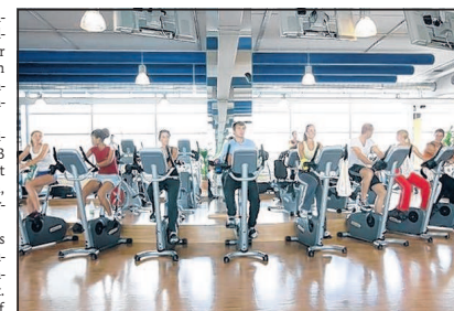
Cardio-Fit ist der Titel eines Herz-/Kreislaufprogramms.

Die angebotenen Kurse finden in der Regel zweimal wöchentlich statt über einen Zeitraum von sechs Wochen. Im Anschluss an die Kurse können die Teilnehmer noch die Wellnessbereiche mit verschiede-