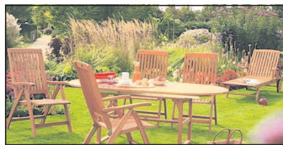
Bei Roller gibt es ausschließlich Gartenmöbel aus Hölzern, die das FSC®-Zertifikat erhalten.

Roller, Deutschlands größter Einrichtungs-Discounter, verkauft in seinen Filialen auch in diesem Jahr nur urwaldfreundliche Hartholz-Gartenmöbel. Darüber hinaus unterstützt das Unternehmen das Greenpeace-Projekt „Urwaldfreundliche Stadt“. Damit leistet der Möbel-Riese einen aktiven Beitrag zum Schutz der bedrohten Regenwälder.