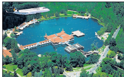
Eineinhalb Stunden dauert der Flug in die westungarische Thermenregion.

Die kleine Republik Ungarn ist dank unzähliger heilkräftiger Thermalquellen eine wahre Zauberwelt für Erholung, Vitalität und Wohlfühlen. Die ungarischen Kurorte erfreuen sich einer besonderen Beliebtheit, weil sie neben Gesundheit vermehrt auch auf Entspannung, Prävention und Wohlbefinden setzen. Das Herz der ungarischen Thermenwelt schlägt mit dem 4,4 ha großen Hévíz Heilsee lediglich sechs Kilometer vom Balaton-Plattensee entfernt in der westungarischen Kurstadt Bad Hévíz. Die Wassertemperatur liegt im Sommer zwischen 33 und 35 Grad Celsius und sinkt selbst im Winter nie unter 24