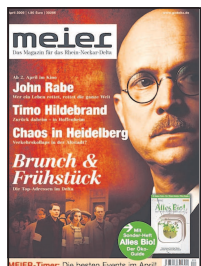
Die April-Ausgabe des „MEIER“.

Schon lange setzt sich Roller für die Schonung des Regenwaldes ein und hat sein Sortiment dementsprechend auf unbedenkliche Hartholz-Gartenmöbel umgestellt. Während dieses Prozesses stand das Familienunternehmen stets in Dialog mit Greenpeace. Außerdem beteiligt sich Roller als einer der Erstunterzeichner einer entsprechenden Vereinbarung an dem Pilot-Projekt „unwaldfreundliche Stadt Freiburg“ der Umweltorganisation. Darin wird zugesichert, keine urwaldschädigenden Hölzer zu vertreiben – für Roller eine Selbstverständlichkeit, die in allen bald 100 Märkten konsequent umgesetzt wird. Dort finden Kunden ausschließlich Gartenmöbel aus Hölzern, die das FSC®-Zertifikat erhalten. Damit beweist der Möbel-Discounter, dass