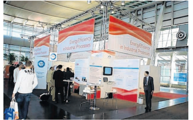
Die Metropolregion Rhein-Neckar präsentierte sich vom 20. bis 24. April erstmals und als einzige Region mit einem gemeinsamen Auftritt regionaler Experten aus dem Bereich "Energie und Umwelt" auf der Hannover-Messe.

Energie sparen, Energie nutzen, Klima schützen – damit kennt sich die Metropolregion Rhein-Neckar (MRN) bestens aus. Sie hat sich daher zum Thema „Energieeffizienz“ auf der Hannover Messe 2009 erstmals und als einzige Region mit einem gemeinsamen Auftritt regionaler Experten aus dem Bereich „Energie und Umwelt“ präsentiert. Die Hannover Messe ist mit über 6.000 Ausstellern aus über 60 Ländern die weltweit größte Industriemesse ihrer Art. Die MRN nutzte das international bedeutende Technologieereignis und dessen diesjähriges Leitthema „Energieeffizienz“, um sich gezielt als „Region der Energieeffizienz“ zu positionieren und insbesondere das Exzellenzfeld „Energieeffizienz in der Industrie“ einem breiten Fachpublikum vorzustellen. Im Rahmen der Messe war die MRN-Präsentation eingebettet in die Sonderausstellung „Energieeffizienz in Industriellen Prozessen“. Diese stand unter der Schirmherrschaft des Bundesministeriums für Wirtschaft und Technologie und versteht sich als zentrales Informationsforum für alle Fragen zum Thema Energieeffizienz, rund um innovative und verbrauchsärmere Produkte, Lösungen und Verfahren. Die MRN war bei der Sonderschau mit regionalen Best-Practice-Beispielen, unter anderem von BASF und MVV sowie mittelständischen Partnern vertreten. „Unsere ‚Energiequelle‘ steckt in unseren Köpfen. Denn