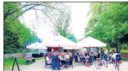
Gemütliches und stilvolles Ambiente: 80 Open-Air-Sitzplätze bietet der Biergarten „Am Unteren Luisenpark“.

INFO: Biergarten „Am unteren Luisenpark“, montags bis samstags ab 11 Uhr geöffnet, sonntags ab 10 Uhr.