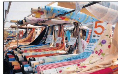
Über 140 Stände finden die Besucher des Original Stoffmarkts Holland alles zum Thema Nähen.