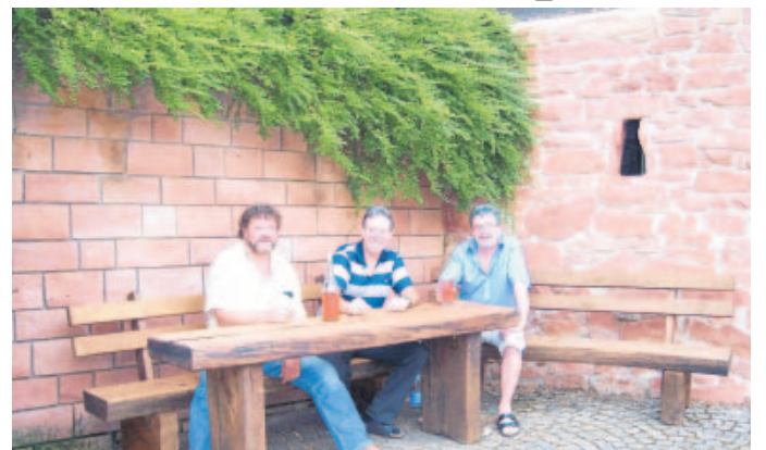
Wohlverdiente Erholung nach dem Aufstellen von Bänken und Tisch.