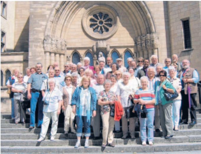
Exkursion des SKFM nach Luxemburg im Juni 2009.

Im staatlich anerkannten Betreuungsverein Sozialdienst Katholischer Frauen und Männer (SKFM) für den Landkreis Südliche Weinstraße e.V. engagieren sich derzeit 184 Bürgerinnen und Bürger ehrenamtlich in der sehr verantwortungsvollen und interessanten Aufgabe als rechtlicher Betreuer. Etwa 220 hilfebedürftige Personen werden im Landkreis Südliche Weinstraße durch den SKFM rechtlich betreut.