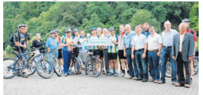
Großer Bahnhof bei der offiziellen Einweihung der Neubeschilderung der Neckartal-Wegs.

Die Neubeschilderung wurde wesentlich vom Wirtschaftsministerium Baden-Württemberg (Landesradfernwege) und der Tourismus Marketing GmbH Baden-Württemberg gefördert. Geplant und koordiniert wurde sie vom Verband Metropolregion Rhein-