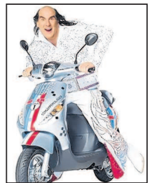
Guildo auf dem Roller, den es zum Jubiläum zu gewinnen gibt.

Roller wird 40 Jahre alt. Im Jahr 1969 war es so weit: Der erste Roller-Markt in Georgsmarienhütte in Westfalen wurde eröffnet. Das Konzept des Möbel-Discounts mit günstigen Möbeln bei guter Qualität und sofortiger Verfügbarkeit war in Deutschland geboren. Die Erfolgsgeschichte, die sich daraus entwickelt hat, ist beeindruckend: Heute ist Roller mit 91 Filialen im gesamten Bundesgebiet vertreten, bietet über 4.000 Mitarbeiter eine sichere Zukunft und erreicht einen Jahresumsatz von über 850 Millionen Euro. Und der Expansionskurs wird fortgesetzt: Schon bald soll die magische Grenze von 100 Filialen überschritten werden.