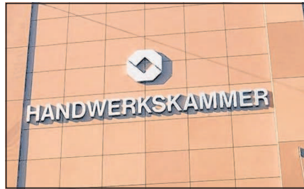
Die Handwerkskammer bietet Fortbildungen an.

BILDUNGSKADEMIE: Lehrgänge für Kfz-Techniker