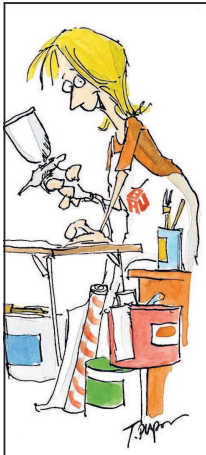
Buntester Job der Welt: Der Maler- und Lackierer-Nachwuchs soll die Tops und Flops der Ausbildung kreativ pinseln und spraysen.

Sie haben den buntesten Job der Welt – die Maler und Lackierer. Auszubildende des „bunten Handwerks“ in Mannheim sollen jetzt mit viel Farbe und Kreativität einen Comic kreieren. Dazu hat der IG BAU-Bezirksverband Nordbaden aufgerufen.