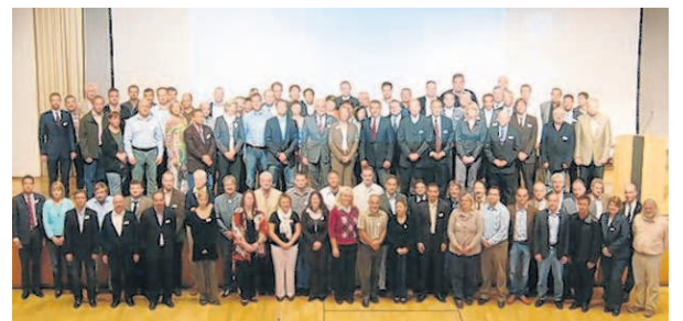
Rund 100 Vertreter informierten sich im Mannheimer Stadthaus über die neue regionale E-Vergabe-Plattform.