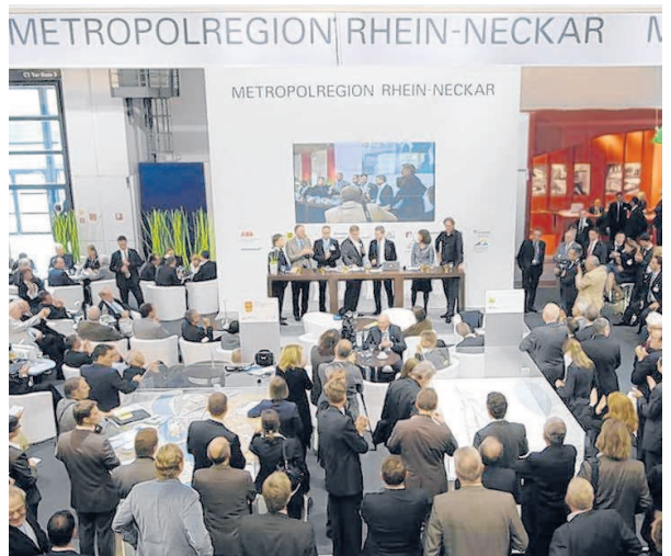
Prominenter Gast am Stand der Metropolregion Rhein-Neckar: Baden-Württembergs Ministerpräsident Günther Oettinger.