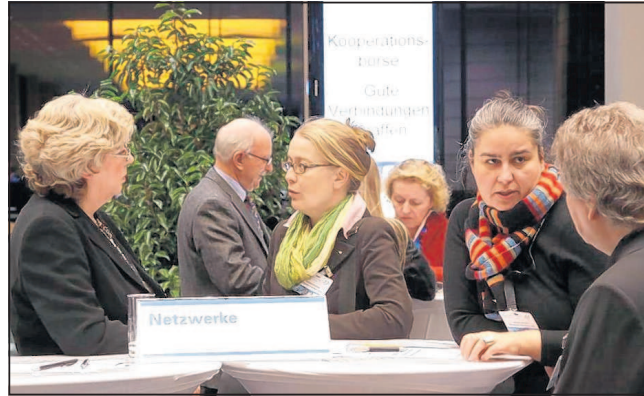
Beim 4. Stiftertag der Metropolregion Rhein-Neckar wurde erstmals im Rahmen der Veranstaltung die Kooperationsbörse „Gute Verbindungen schaffen“ angeboten, um den Dialog zwischen Stiftungen, Unternehmen und Einzelpersonen gezielt zu fördern.

MRN: 4. Stiftertag / Regionale Informations- und Kontaktplattform