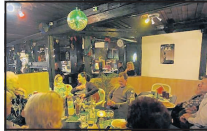
Gemütlich und rustikal: das „Let's dance“.

Günstige Getränkepreise und eine gemütlich-rustikale Einrichtung sind nicht die einzigen Gründe, die Gaststätte „Let's dance“ in C 8, 12 zu besuchen. Am 7. November haben Mona Kress und Adolf Schätz in der ehemaligen „Thingstätte“ ihre Gaststätte eröffnet und wollen das Publikum auch mit besonderen Aktionen ins „Let's dance“ locken.