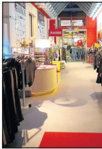
Der schöne und einladende Eingang des Embargo in T2, 4.