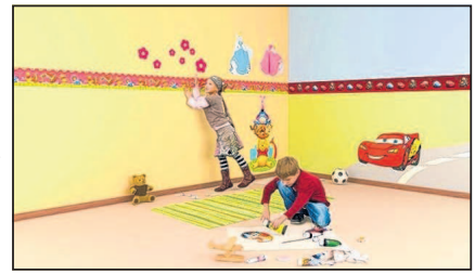
Projektschauen im Februar zeigen, wie man tolle Kinderzimmer gestalten kann.

Für die Mädchen wird der Baumarkt zum Abenteuerspielplatz. Mit einer Schatzkarte ausgestattet, su-