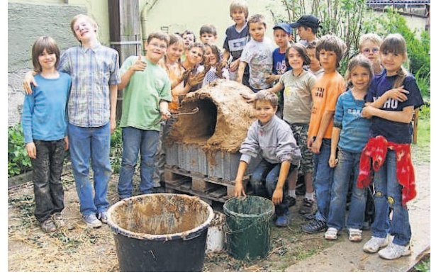
Der „Kern-Lehmofen“ des Projekts „Umweldiplom des Nabu in Landau“, eines der Projekte, das die SAP 2009 gefördert hat.

Einige der heute zum Teil auch überregional bekannten Projekte erhielten so in ihren Anfangstagen wichtige Starthilfen wie die Astronomieschule in Heidelberg,