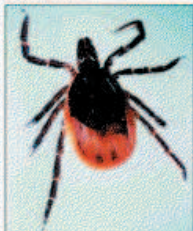
Die aktuellen FSME-Verbreitungskarten finden Sie unter www.zecken.de. Infos speziell für Kinder auf www.zeckenschule.de

geimpft ist, sollte dies zu Beginn der schönen Jahreszeit nachholen. Impfen kann jeder Haus- oder Kinderarzt. Die Kosten werden von den gesetzlichen Krankenkassen übernommen.