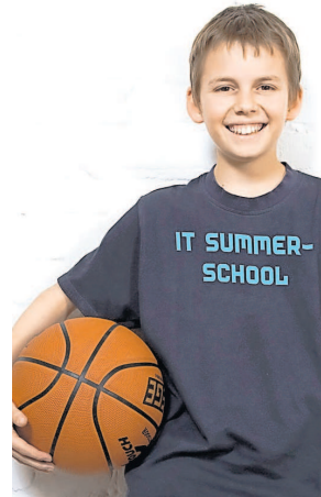
Die IT Summerschool wird in diesem Jahr zum dritten Mal vom IT & Medien Netz Rhein-Neckar organisiert.

einander abgestimmtes gemeinsames Bildungsangebot. Kinder und Jugendliche ab der 3. Klasse werden dabei ganztags betreut und geschult. So sollen die jüngeren Schülerinnen und Schüler beim Basteln spielerisch an Technikfragen herangeführt werden und genügend Raum für Bewegung finden. In Heidelberg erwarten die Teilnehmer sogar sportliche Angebote wie Klettern und Schwimmen. Jugendliche bis zur Abiturstufe bewegen sich sogar schon fast auf den Spuren der Profis und erhalten ein Lehrangebot für Fortgeschrittene. Alle Kurse werden von Fachpersonal betreut und sind in ein lockeres Ferienprogramm eingebettet. Weitere Infos und Anmeldung für die einzelnen Ferienkurse und Workshops der IT Summerschool sind ab sofort im Internet unter www.itsummerschool.de zu finden. (ps)