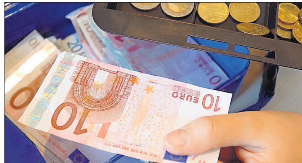
Bei einem Arbeitslohn bis zu rund 11 200 Euro im Jahr können Studenten die abgezogene Lohn- und Kirchensteuer beziehungsweise den Solidaritätszuschlag in vollem Umfang zurückerhalten.

Bei der Lohnsteuerabrechnung durch den Arbeitgeber wird unterstellt, dass während des ganzen Jahres Arbeitslohn bezogen wird. Da Ferienarbeit aber nur in eini-