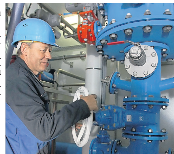
Die modernisierte Enthärtungsanlage im Wasserwerk Rheinau soll Kunden in Mannheim und der Region zuverlässig mit Wasser von hoher Qualität beliefern.

Nach rund zehnmonatiger Bauzeit hat das Mannheimer Energieunternehmen MVV Energie eine neue Enthärtungsanlage im Wasserwerk Rheinau in Betrieb genommen. Sie ersetzt die bisherige Anlage, die seit 1983 das im Mannheimer Süden geförderte Grundwasser enthärtet hatte. Mit der neuen Enthärtungsanlage investiert das Unternehmen in eine nachhaltige Wasserversorgung und stellt auch in Zukunft die Trinkwasserversorgung für die Stadt Mannheim und die Region in gewohnt hoher Qualität sicher.