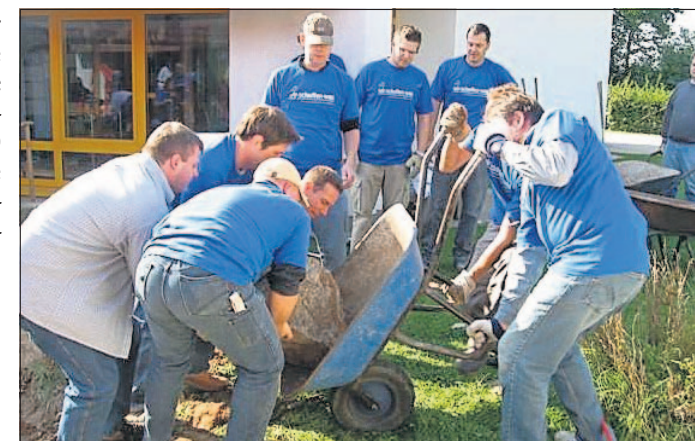
Alle packen mit an – am 18. September heißt es wieder „Wir schaffen was!“ in der Metropolregion.

Auskünfte zum Freiwilligentag gibt es auch per E-Mail ( freiwilligentag@m-r-n.com ) oder telefonisch unter 0621-12987-75. Ermöglicht wird der 2. Freiwilligentag in der Metropolregion Rhein-Neckar durch die Unterstützung der Unternehmen BASF und SAP. (ps)