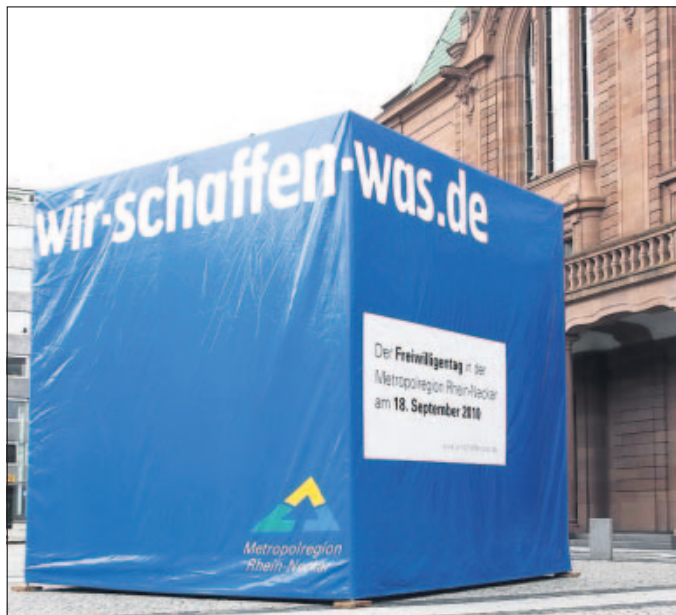
Kündigen überall in der Region den Freiwilligentag am 18. September an: die blauen „Wir schaffen was“-Würfel, wie hier vor dem Mannheimer Rosengarten.

Die zweite Auflage des Freiwilligentages steht unter dem Motto „Engagement fördert Bildung“. Nachdem im Jahr 2008 rund 6700 Helfer dabei waren, sind nun erneut Einzelpersonen, Familien, Freunde, Firmen- und Vereinsteamer dazu aufgerufen, ihre