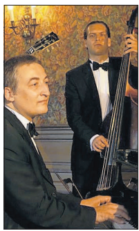
Das Trio „Tea für Three“ sorgt für musikalischen Schwung.

Die Freude an Farben und Liebe zum Schönen und Positiven in ihren in Acryltechnik entstandenen Gemälden Elfriede Breitweisers erschlossen sich auf den ersten Blick. Unter der wie immer charman- ten und geistreichen Moderation des Schauspielers Uwe Heene wurden zwei Werke der beiden Künstler bei der Finissage auch versteigert.