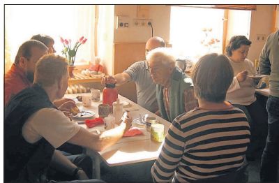
Bereits beim Freiwilligentag vor zwei Jahren kam dieses Projekt sehr gut an: Das Frühstück für benachteiligte Menschen im „Lichtblick“ in Neustadt.