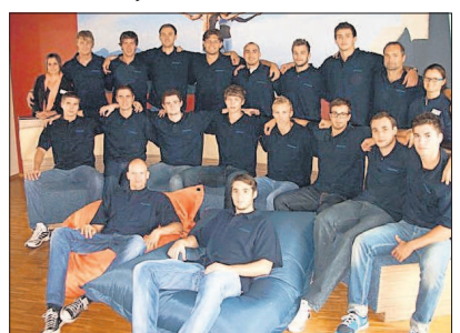
Die Bundesliga-Handballer der TSG Friesenheim.

Pfitzenmeier: Jetzt Partner der TSG Friesenheim