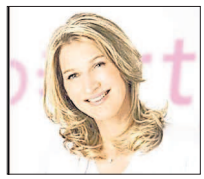
Tennislegende Steffi Graf hat das Mrs.Sporty-Trainings- und Ernährungskonzept entwickelt.

Happy Birthday, Mrs.Sporty! Seit einem Jahr bringt der Frauensportclub Bewegung und gesunde Ernährung nach Mannheim – mit tollen Erfolgen – 5 cm Taillenumfang haben die Mitglieder im Schnitt in nur drei Monaten verloren. Das Besondere ist: Bei Mrs.Sporty werden keine Kalorien gezählt, sondern mit Spaß die individuellen Ziele erreicht. Mrs.Sporty feiert mit seinen Mitgliedern Jubiläum. Dabei stehen die Erfolge der Mitglieder im Vordergrund und das gibt doppelten Grund zum Feiern. „Was mich überzeugt hat, ist dass ich mir nicht allein überlassen war. Und das führte bei mir endlich zum Erfolg. Mit dem Ergebnis, dass ich jetzt zwei Kleidergrößen weniger trage. Und ich war überrascht, dass der Erfolg von Dauer ist. Also eigentlich ist das die Wunderpille die ich so lange gesucht habe. Ich möchte es nicht mehr missen,