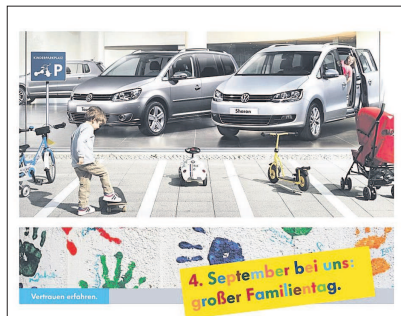
Der neue Sharan und der neue Touran werden beim Familientag vorgestellt.

Unter dem Slogan „Das Wochenende gehört der Familie“ finden am 4. September, 10 bis 16 Uhr, zusammen mit der Markteinführung des neuen Sharan und Touran, die Volkswagen Familientage statt. Hierfür verwandelt sich das Autohaus in einen Spielplatz für Groß und Klein.