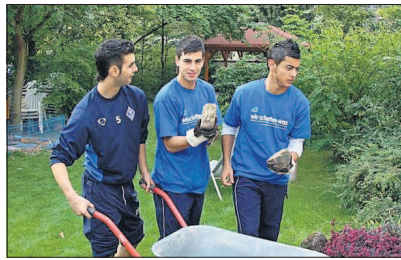
SV Waldhof-Jugendspieler renovieren im Jahr 2008 den Garten der Lebehilfe Mannheim e.V.