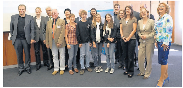
Engagieren sich für die Metropolregion Rhein-Neckar: Die Nominierten für den MRN-Bürgerpreis 2010.

Sie wollen alte Volkslieder und Heimatlieder für die Nachwelt konservieren, ehrenamtliche Ersatzgroßeltern vermitteln oder die Werte- und Ethikdiskussion an den Hochschulen in der Region anregen. Die Bandbreite der acht Projekte, die für den Bürgerpreis der Stiftung Metropolregion Rhein-Neckar nominiert sind, ist erstaunlich groß. Insgesamt waren 67 Bewerbungen in den drei Kategorien „Junioren“, „Starter“ und „Profis“ eingegangen. Der Bürgerpreis wird zum zweiten Mal nach 2008 bei einer festlichen Preisverleihung am 30. September im Mannheimer Rosengarten vergeben. „In den Köpfen der Menschen schlummern hervorragende Ehrenamts-Ideen. Mit dem Bürgerpreis möchten wir diese Wirklichkeit werden lassen. Das unterscheidet unsere Auszeichnung von den bestehenden, die zumeist abgeschlossene Projekte würdigen“, sagte Dr. h.c. Manfred Lautenschläger, Vorsitzender des Stiftungsrates der Metropolregion Rhein-Neckar. Gesucht wurden Projekte, die sich bestehender Herausforderungen in der Region annehmen und einen Beitrag zum Miteinander in der Region leisten. Das Preisgeld in Höhe von 10.000 Euro soll der Umsetzung der Vorhaben dienen. In der Kategorie „Profis“ (Personen, die ihre Vorhaben inner-