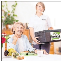
Die Gerichte werden jetzt auch am Wochenende heiß geliefert.