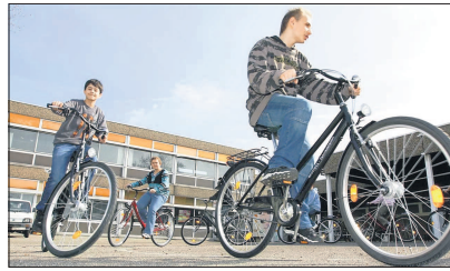
Auch Mobilitätstraining ist förderwürdig.

Der Sponsoringfonds des Mannheimer Energieunternehmens MVV Energie geht in die nächste Ausschreibungsrunde: Am 1. September startete der mittlerweile zwölfte Sponsoringfonds, in dem sich wieder Vereine, Institutionen und Organisationen aus der Metropolregion Rhein-Neckar um den mit 50.000 Euro ausgestatteten Fördertopf bewerben können.