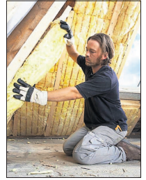
Eine Dachdämmung ist kostengünstig und mit ein wenig Geschick leicht in Eigenregie zu bewerkstelligen.

Im Vergleich zu anderen Sanierungsmaßnahmen wie beispielsweise der Fassadendämmung ist die Dachdämmung kostengünstig