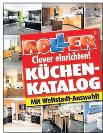
Der neue Küchenkatalog von Roller.

Der Roller-Küchenkatalog hilft, bei der Vielzahl an Möglichkeiten, die man heute bei der Planung einer Küche hat und den wechselnden Trends den Überblick zu behalten. Für Kunden, die den Kauf planen, ist er daher längst Standard, um zu wissen, was aktuell angesagt ist. Das Unternehmen zeigt in seinem Katalog eine große Auswahl seiner schönen, anspruchsvollen und dennoch günstigen Modelle namhafter Küchen-Hersteller.