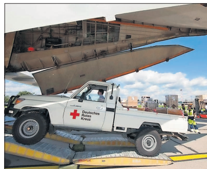
Der Landcruiser beim Verladen, damit er an seinem Einsatzort ankommt.

Das Unternehmen will gemeinsam mit seinen Kunden ein Zeichen setzen: Durch die Spende einer Wasseraufbereitungsanlage, die in Kooperation mit dem DRK im Flutgebiet bereitgestellt wird.