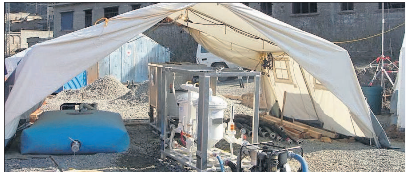
Für die Opfer der Flutkatastrophe in Pakistan spendet die Firma Segmüller eine Trinkwasseraufbereitungsanlage (Bild oben) und einen Toyota Land Cruiser (Bild unten).