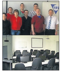
IBS bildet hochkompetent zur Sicherheitskraft aus.

Sicherheitsausbildung, Weiterbildung, Umschulung, Sachkunde, Lehrgänge, Stellenangebote - das IBS Institut in Darmstadt - Ihr kompetenter Partner für Sicherheitsausbildung, Weiterbildung und Umschulung.