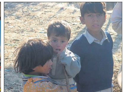
Im Norden Pakistans ist das Wasser mittlerweile abgeflossen. Im Süden stehen viele Flächen weiter unter Wasser. Trinkwasser ist für viele Kinder Mangelware.

Diese pragmatische Hilfe mit sauberem Wasser tut nach Auskünften der Weltgesundheitsbehörde WHO sowie der UNO in den Elendsgebieten am meisten Not, kommt garantiert richtig an - und macht Sinn! Denn die Ironie des Elends ist die traurige Tatsache, dass die Natur zu viel verschmutztes und verseuchtes Wasser bescherte, aber kein dringend benötigtes Trinkwasser. Um diese Anlage direkt in die betroffenen Gebiete zu transportieren, wird zusätzlich noch ein Toyota Landcruiser gestiftet.