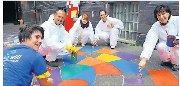
So wie hier in der Ludwigshafener Gräfenaus Schule packten Tausende Helfer beim Freiwilligentag fleißig mit an.

Der zweite Freiwilligentag in der Metropolregion Rhein-Neckar war ein voller Erfolg: Bei bestem Spätsommerwetter haben am Samstag, 18. September, mehrere Tausend Ehrenamtliche unter dem Motto „wir-schaffen-was“ in über 250 Projekten und vielen begleitenden Aktivitäten tatkräftig mit angepackt.