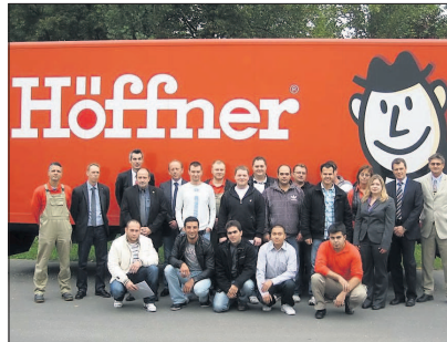
Nach sieben Monaten intensiver Schulung und Einarbeitung sind die 15 Monteure am Ziel.

Nach sieben Monaten intensiver Schulung und Einarbeitung haben Anfang Oktober 15 Möbelmonteure einen Arbeitsvertrag im Hause Höffner Schwetzingen unterschrieben und sind seither in der Auslieferung der Möbel und Küchen tätig.