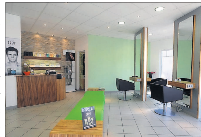
Stilvolles Ambiente in der Filiale in Edingen.

„Du bist schöner als Du denkst“ ist das Motto in der beiden neu eröffneten Filialen des Friseurmeisterbetriebs „Il Figaro“ in der Hauptstraße 106 in Edingen und der Mannheimer Straße 288 in Wieblingen. Das bestens geschulte Fachpersonal geht im Beratungsgespräch auf die individuellen Wünsche der Kunden ein und lässt Frisurenträume wahr werden.