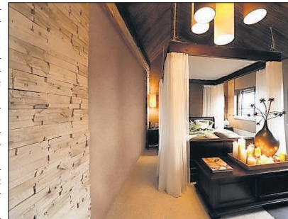
Noch bis zum 30. Oktober gibt es bei Hornbach die Projektschau „Wände gestalten“.

Die Wissenschaft bestätigt: Menschen nehmen mehr als 80 Prozent der Reize über das Sehen wahr. Vor allem Farben wirken unterschiedlich auf die persönliche Stimmung. So vermitteln beispielsweise warme Sommertöne ein Gefühl des Wohlbefindens, der Behaglichkeit und des Komforts.