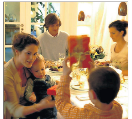
Nach den Feiertagen kommt die große Leere.

Silvester bietet sich dann wiederum an, um etwas Neues zu planen. „Die meisten brauchen Ziele, ein Projekt, eine positive Erwartung“, sagt Ulrich Fath, „Irgendetwas, worauf man hinarbeiten und sich wieder freuen kann.“ (ps)