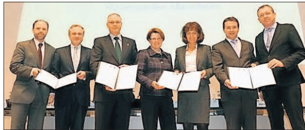
Vertreter von Bund, Ländern und Region im Schulterschluss für bundesweites Modellvorhaben.

Verwaltungsvereinfachung: Kooperationsvereinbarung unterzeichnet