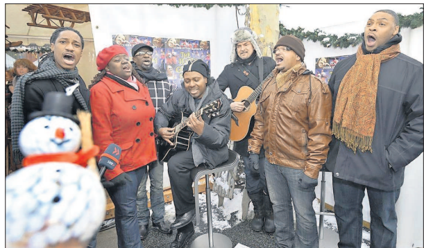
Die Harlem Gospel Singers mit Kosho auf dem Weihnachtsmarkt auf den Kapuzinerplanken.

Konzert: Die Harlem Gospel Singers sind am Sonntag im Mannheimer Rosengarten