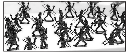
Das ultimative Glückssymbol zu Silvester: der Schornsteinfeger.

HWK: Schornsteinfeger mehr als nur Beruf