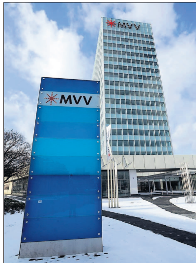
Die MVV hat den Stromabsatz um 23 Prozent gesteigert.