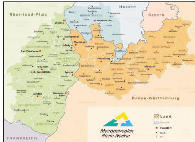
Landkreise, Städte und Gemeinden aus Baden-Württemberg, Hessen und Rheinland-Pfalz ziehen an einem Strang.

ben der MRN sind die Wissenschaft, Wirtschaft und Lebensqualität in der Region zu stärken.