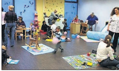
Hier ist der Nachwuchs in besten Händen.

Vor wenigen Wochen wurde die neue Kinderbetreuung im Wellness & Fitness Park eröffnet, die sich in der Ladengalerie im Seilwolff-Center Mannheim-Neckarau befindet.