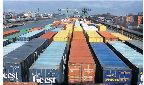
Der Export-Motor brummt: Rund 58 Prozent der in der Region produzierten Güter werden ins Ausland verkauft. Hier das Hafenzentrum Mannheim-Ludwigshafen.

Der Konjunkturindex, der sich aus den Bewertungen der Geschäftslage und den Geschäftserwartungen errechnet, liegt zu Jahresbeginn bei 131 Punkten (Hoch/Tief: 140/60 Punkte). Zwar sei das Vorkrisen-Niveau damit noch nicht wieder erreicht,