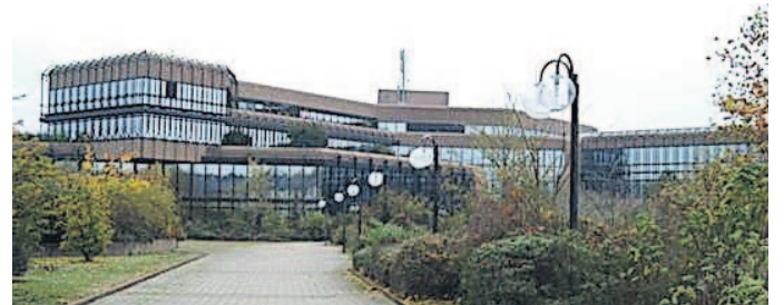
Zentrale regionale Anlaufstelle für Studieninteressierte am Samstag, 19. März 2011: Hochschule der Bundesagentur für Arbeit in Mannheim.

Das Programm besteht zum einen aus einer zentralen Messe bei der Hochschule der Bundesagentur für Arbeit in Mannheim-Neustadt mit 60 Ausstellern und Basisvorträgen zu Themen wie Studienentscheidung, Bewerbung, Zulassung und Stipendien (Samstag, 19.3. 9 bis 15 Uhr). Es folgen zum anderen rund 90 weitere Info-Veranstaltungen zu einzelnen Studienangeboten, ihren Anforderungen und Karriereperspektiven