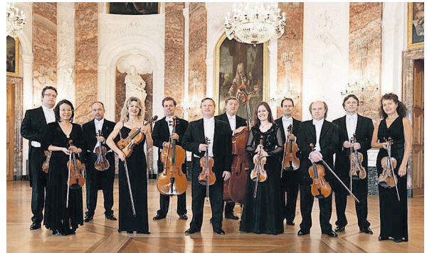
Spielt am 10. April im Hambacher Schloss für den guten Zweck: das Kurpfälzische Kammerorchester.

Der Verein Zukunft Metropolregion Rhein-Neckar (ZMRN e.V.) unterstützt am Sonntag, den 10. April ab 18 Uhr, ein Benefizkonzert des Kurpfälzischen Kammerorchesters (KKO) im Hambacher Schloss.