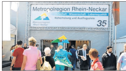
Informationscenter und Showbühne unter einem Dach: die Halle 35 auf dem Maimarkt.

Auf der Aktionsfläche hat sich eine illustre Schar tierischer Gäste angekündigt, darunter Nashornleguan „Johnny“ vom Tiergarten Worms und die Alpakas vom Bergtierpark Fürth-Erlenbach. Imposante Greifvögel wie Wüstenbussard und Cordillerenadler kann man beim Falkner der Deutschen Greifenwarte Burg Guttenberg aus nächster Nähe bewundern. Faszinierende Tiere aus dem Bereich „Gekreuch und Geflecht“ präsentiert Zoo Heidelberg und Reptilium Landau.