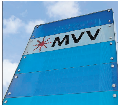
Die 24/7 Netze GmbH ist eine gemeinsame Tochtergesellschaft von MVV Energie und Energieversorgung Offenbach.

Die 24/7 Netze GmbH, eine gemeinsame Tochtergesellschaft von MVV Energie und Energieversorgung Offenbach (EVO), hat mit Ablauf des Monats April den Vertrag mit dem Energieanbieter TelDaFax GmbH zur Nutzung der Gasnetze in den Netzgebieten von Mannheim und Offenbach gekündigt.