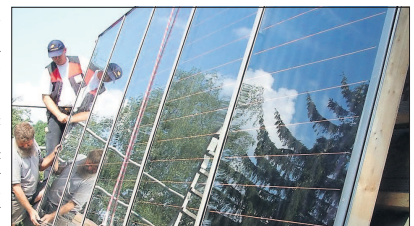
Das Erneuerbare-Wärme-Gesetz des Landes Baden-Württemberg gilt für Gebäude im Bestand seit dem 1. Januar 2010.

HWK: Experten informieren bei Veranstaltung