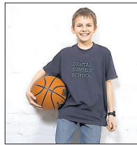
„Lust auf spannende Ferien? Ab sofort läuft die Anmeldung zur Digital Summerschool in der MRN“

Sechs Wochen Schulferien liegen vor Schülern und Eltern in der Metropolregion Rhein-Neckar. Für berufstätige Eltern eine Herausforderung, wenn es um die Betreuung der Kinder geht. Dem kann die Digital Summerschool 2011 Abhilfe schaffen. Bereits zum vierten Mal findet das Ferienprogramm für Kinder und Jugendliche im Alter von neun bis 19 Jahren in Zusammenarbeit mit Hochschulen, Bildungseinrichtungen und dem Theatenseum in Mannheim, Ludwigshafen und Heidelberg statt.