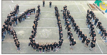
Firmen, die motivierte und ambitionierte Azubis suchen, finden auf www.hauptschultalente.de Kurzporträts zu aktuellen Absolventen des Modellprojekts KÜM (im Bild die Schüler der Regionalen Schule Lingenfeld).

KÜM: Schüler suchen noch Ausbildungsplätze – Aufs Berufsleben vorbereitet