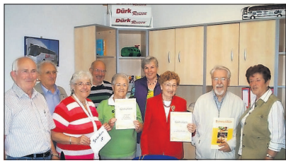
Die Gewinner freuen sich über ihre Preise.

Weitere Informationen: Dürk Reisen, Am Lausbühl 6, 67227 Frankenthal - Studernheim, Telefon 06233 46066, Internet: www.duerk-reisen.de