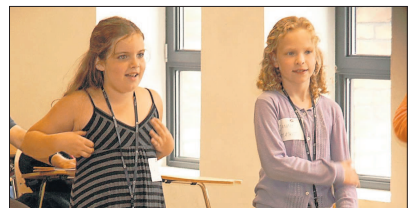
Spannung: Kindercasting für das Musical EVITA.