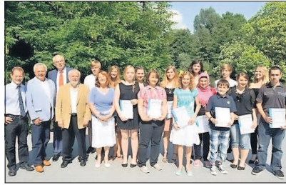
Nach der Preisübergabe: die Gewinner mit der Jury.