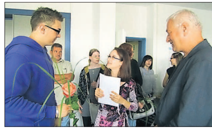
Alle Azubis erhielten ihr Abschluszeugnis und eine Rose.

Die alternative Berufsausbildung mit dem etwas sperrigen Namen „Berufsausbildung in außerbetrieblichen Einrichtungen in Kooperation“ – kurz „Ba-