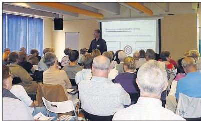
Startschuss im Wellness & Fitness Park Schwetzingen.

Pfitzenmeier: Dreimonatiger Test gestartet