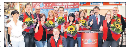
Die besten Auszubildenden bei Roller wurden geehrt.

Die guten Ergebnisse führen weiterhin dazu, dass über 30 der frischgebackenen Einzelhandels-