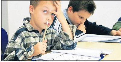
Die LOS bieten fachgerechte Hilfe für gute Noten.

LOS: Hilfe bei Lese-/Rechtschreibschwäche