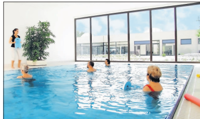
Neun Monate dauerte die Fertigstellung des Bewegungsbads.

Aber nicht nur an die Rehapatienten wurde gedacht. Ab September/Oktober eine ganze Reihe von Wasserkursen im Rehazentrum angeboten, bei denen für jeden etwas dabei ist. Um allen Mannheimern auch die weiteren neuen Therapiemöglichkeiten näherzubringen, lädt das Rehazentrum für Sonntag, 25. September zum Tag der offenen Tür ein. Von 10 bis 17 Uhr kann das Schwimmbad besichtigt werden,