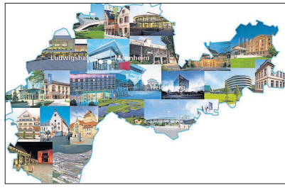
Viefältigste Möglichkeiten bietet die Kongress-, Tagungs- und Eventlandschaft MRN.

Laut der Fachstudie muss die MRN den Vergleich mit etablierten