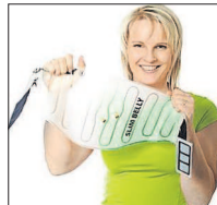
Der „Slim-Belly“ verspricht sensationelle Ergebnisse.