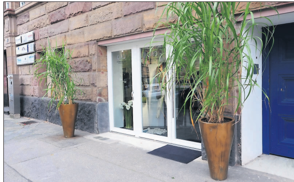
Exklusiv ist auch die Lage in der Augustaanlage.