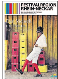
Kostenlos erhältlich unter www.festivalregion.de : die Festival-Höhepunkte bis Ende des Jahres.

Zusammen rund 300.000 Besucher zählen allein jährlich die 15 größten Veranstaltungen - die Top-Festivals der MRN. Bundesweit einmalig ist deren gemeinsame länderübergreifende Vermarktung als „Festivalregion Rhein-Neckar“. Zweimal im Jahr erscheint dazu bereits seit 2007 ein eigenes Magazin, das die Highlights der jeweils aktuellen Spielzeit vorstellt. Die zweite Ausgabe für 2011 informiert insbesondere über die im Oktober und November anstehenden Events „Festspiele Ludwigshafen“ (6.10.-11.12.) und „60. Internationales Filmfestival Mannheim-Heidelberg“