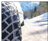
Autofahrer sollten frühzeitig an die Winterreifen denken.

Außerdem gilt seit vergangener Winter die Winterreifenpflicht: Wer bei winterlichen Straßenverhältnissen falsch befreit fährt, riskiert neben seiner