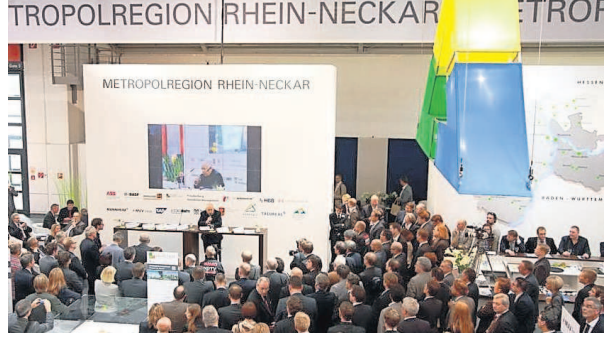
Großer Andrang am MRN-Stand auf der Expo Real in München während des Vortrags von Heiner Geißler.