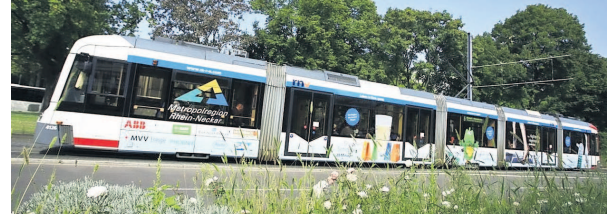
Rollende Botschafterin der Region: die RNV-Linie 5 mit dem MRN-Logo und flotten Sprüchen.