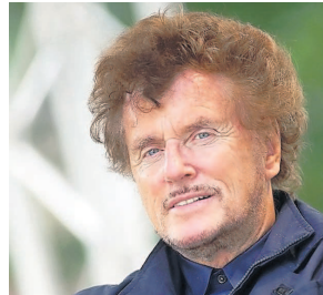
Eröffnungsdredner beim Existenzgründungstag: Regisseur Dieter Wedel.

Eingebettet in die bundesweite Gründerwoche findet dort der 13. Existenzgründungstag der Metropolregion Rhein-Neckar statt. Von 9 bis 17.30 Uhr bietet er angehenden Unternehmerinnen und -Unternehmern bei freiem Eintritt ein umfassendes Beratungs- und Fortbildungsprogramm rund ums Thema „Gründung und Selbständigkeit“. Profis aus der Praxis lösen in mehr als 20 Vorträgen und Gesprächsrunden die wichtigsten Fragezeichen auf - angefangen bei der Vorbereitung auf das erste Bankgespräch über die Unternehmensabsicherung bis zur gekonnten Vermarktung der Geschäftsidee und vielem mehr. Eine begleitende Messe mit über 60 fachkundigen Ausstellern ermöglicht während des ganzen Tages wertvolle Kontakte und den unverbindlichen Erfahrungsaustausch. Gleiches gilt für die Kooperationsbörse, bei der man Mitstreiter für das eigene Vorhaben suchen kann. Die Kinder-Betreu-