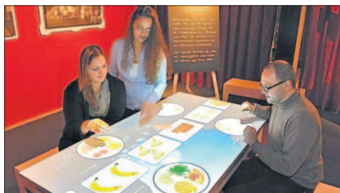
Interaktive Stationen sind lehrreich und unterhaltsam.

Über 400 Objekte werden auf 900 Quadratmetern Ausstellungsfläche gezeigt. Integraler Bestandteil der Schau sind interaktive Sta-