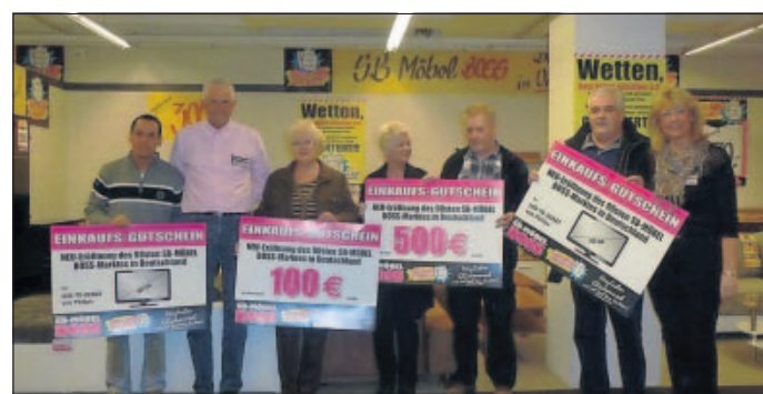
Die Gewinner des Möbel-Boss-Gewinnspiels.