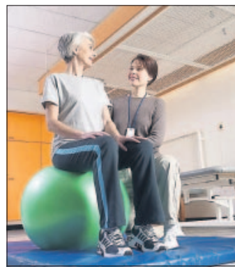
Macht fit: Rückentraining bei Pfitzenmeier.

Rückenprobleme – rund 80 Prozent der deutschen Bevölkerung leiden sporadisch oder chronisch unter Rückenschmerzen. Zahlreiche Studien zeigen, dass Rückenbeschwerden vor allem bei Personen mit sitzenden Tätigkeiten in den letzten Jahren drastisch zugenommen haben. Gründe dafür sind Bewegungsmangel und einseitige Beanspruchung des Körpers; physiologisch betrachtet ist der Mensch eigentlich ein „Bewegungstier“ – Muskulatur und Skelett sind nicht so gebaut, dass sie permanentem Sitzen standhalten können. Mit der größten Rückenstudie in der Metropolregion Rhein-Neckar Vorderpfalz möchte die Unternehmensgruppe Pfitzenmeier den Beweis antreten, dass ein gezieltes Training der Rücken-, Gesäß- und Rumpfmuskulatur, eine wirkungsvolle Maßnahme zur Vorbeugung und Beseitigung von Rückenbeschwerden ist. Die vierwöchige Studie beginnt am 14. November und wird in allen Wellness & Fitness Parks der Region sowie im MediFit Gesundheitszentrum Schwetzingen durchgeführt. Die Teilnahme beinhaltet ein effektives Trainings-