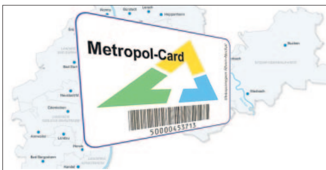
Mit der „Metropol-Card“ können Leseratten in 21 kommunalen Bibliotheken und deren Zweigstellen aus zirka 1,6 Millionen Büchern und anderen Medien wählen.

Mit der Metropol-Card können Leseratten bei allen teilnehmenden Stellen auf insgesamt 1,6 Millionen Medien wie Bücher, CDs, DVDs und andere elektronische Datenträger zugreifen. Für Er-