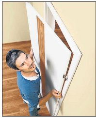
Türaustausch leicht gemacht. Die Projektschau zeigt, wie es geht.

Die Mitarbeiter von Hornbach zeigen während der Projektschau vom 3. bis zum 26. November (immer freitags von 17 bis 18 Uhr und samstags von 10 bis 11 und 14 bis 15 Uhr), was die Heimwerker beim Einbau der Zimmertüren und bei der Montage der Türdrücker zu beachten haben. Außerdem können Interessierte sich auf der Ausstellungsfläche anhand der ausgestellten Türbeispiele einen Überblick über die verschiedenen Modelle und deren Kombinationsmöglichkeiten verschaffen.