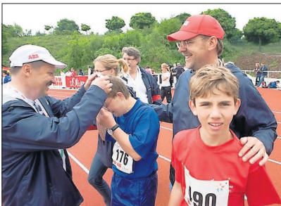
Bei den National Games nehmen Mitarbeiter aus allen ABB-Standorten bundesweit teil. So entstehen Netzwerke und Freundschaften, die auch im Geschäftsleben genutzt werden.