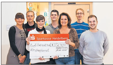
Engagement lohnt sich: Scheckübergabe beim Kinderplanet.

Unter dem Motto: „Charity rocks the House“ hatten die Besucher ein abwechslungsreiches Abendprogramm erlebt – mit Welcome-Drink, Styling-Lounge, Spendenaktionen und einem „Ugly-Tattoo-Contest“. Die Organisatoren dankten DJ Mojiito und DJ Sven Benz, die aus der Region die Plattenteller zum Glücken brachten. Fünf Live-Bands wie Admiral Camilla, Edelweiss, Everla-