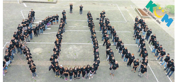
KÜM kommt an: Mehr als doppelt so viele Hauptschüler wie bisher steigen nach dem Abschluss direkt in eine Ausbildung ein (im Bild Schüler der Regionalen Schule Lingenfeld).

Immer mehr Schüler, insbesondere auch mit Migrationshintergrund, finden Dank der professionellen und kontinuierlichen Begleitung direkt und damit