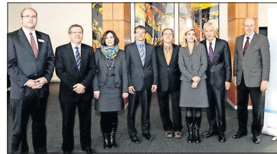
Die Nominierten für den Innovationspreis.

30 hochkarätige Bewerbungen waren für den MRN-Innovationspreis eingegangen, den die Stiftung Metropolregion Rhein-Neckar in diesem Jahr zum fünften Mal an herausragende Forscher und Entwickler aus der Region vergibt. In die Runde der letzten Drei schafften es zwei Projekte aus dem Bereich Medizintechnik und eine Bewerbung aus dem Bereich Materialien und Werkstoffe.