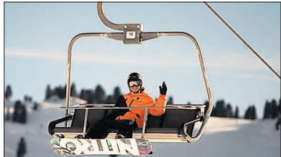
Auf geht's in die Vogesen.

Pfitzenmeier: Skitagestrip am 4. Februar