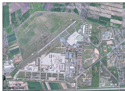
Mit 216 Hektar allein die größte einzelne Konversionsfläche der Region: Die bis 2015 frei werdenden Coleman Barracks in Mannheim-Sandhofen.

In ihrer Grundsatzerklärung setzt sich auch die IHK für eine regionale Abstimmung im Konversionsprozess ein, und betont dabei, dass dies auch die Chance erhöhe, die „Vision 2025“ der Metropolregion Rhein-Neckar zu verwirklichen - also